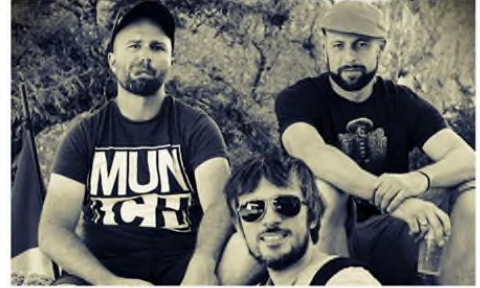
Home / Actu / Le titre du jour : Neuroïne de Noïss